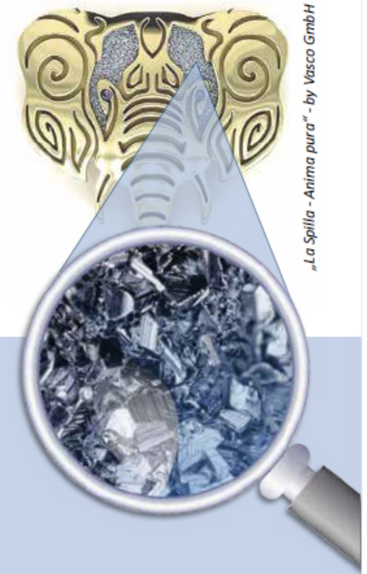
„La Spilla - Anima pura“ - by Vasco GmbH

Erweitern Sie Ihre Visibilität durch Innovation! The sky is the limit!