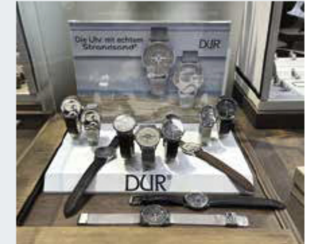
Die Marke aus Oldenburg hat auf der Inhorgenta mit „Strandsand“ ihre erste Uhrenkollektion vorgestellt.

Der Händler kann „sein Thema“ finden und aufs Zifferblatt bringen. Das kann Granit sein, Bergbaukohle, Metallspäne, Lavasand oder Nagelfluhgestein. „Wir können alles verarbeiten, was härter ist als Bernstein“, sagt Wismann. Was ihn besonders freut: Auf der Inhorgenta habe das Interesse aus Bayern und Österreich stark zugenommen. Auch die Händler weit entfernt von der Küste haben also verstanden. #