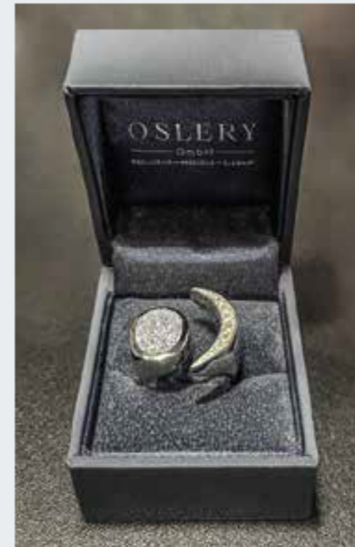
Osmium ist der hellste Stern am aktuellen Schmuckhimmel. Im kristallinen Zustand eignet sich das seltenste Edelmetall hervorragend für die Schmuckherstellung, wie Oslery auf der Inhorgenta gezeigt hat.

denn das kristalline Osmium verfügt über einzigartige Strukturen, ist somit absolut fälschungssicher und eignet sich als Wertanlage mit Potenzial auf Wertsteigerung. Auch hier wieder ein Superlativ: Man benötigt 333 Tonnen Platinerz, um ein Gramm Osmium zu erhalten (die Produktionsmenge beträgt ca. 100 kg pro Jahr). Je weniger also Platin gefordert wird, desto seltener wird Osmium. Apropos Superlativ: Ende März wurde die teuerste neue Geige der Welt vorgestellt. Die Osmium Violin 1.0 mit 541 Einlegearbeiten aus Osmium und rund 300 Brillanten wird nun zum Kauf angeboten und hat einen Ausrufpreis von 3,5 Millionen Euro. #