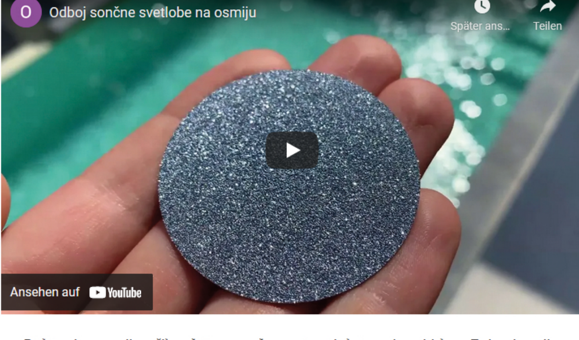
Ansehen auf YouTube

Poleg investicijskih izredov v diskah in ploščicah je na voljo tudi v oblikah za vdelavo v nakit. "Vse več proizvajalcev prestižnega nakita se za osmij odloča zaradi visoke vrednosti, privlačnega videza in izjemnega sijaja, saj se na kristalni površini osmija svetloba odbija bolj kot na diamantih. Poleg standardnih oblik jim omogočamo izdelavo posebnih oblik po njihovih željah," je še povedal Senekovič.