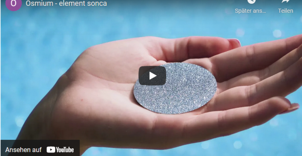
Ansehen auf YouTube

V Osmium inštitutu Slovenija vam zagotavljajo zanesljive storitve, ažurne informacije in strokovno svetovanje, preprost proces naročila, varno in zavarovano dostavo ter diskretnost. Ne zamudite priložnosti, kot je še ni bilo, in postanite lastnik najplemenitejše med vsemi plemenitimi kovinami.