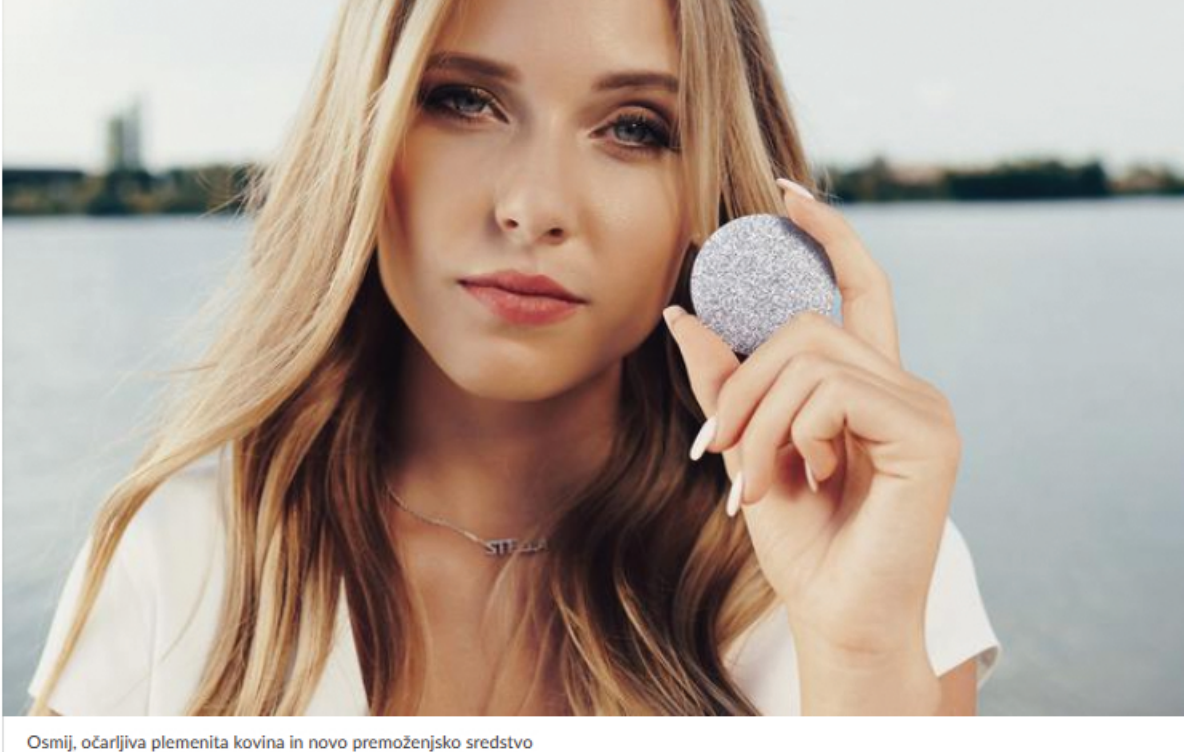
Osmij, očarljiva plemenita kovina in novo premoženjsko sredstvo

Razloge za povečanje privarčevanega denarja gre iskati predvsem v državnih ukrepih na trgu dela, povezanih s koronavirusom. Glavni dejavnik porasta stopnje varčevanja gospodinjstev v lanskem letu je bilo t. l. pristilno varčevanje, ki je povezano z nezmožnostjo trošenja v času epidemije. Zlasti spomladi, na začetku epidemije, je velika negotovost spodbudila tudi previdnostno varčevanje. Zaradi ustavitve javnega življenja ob epidemiji covid-19 se je potrošnja zmanjšala za 2,6 milijarde evrov in primerljivi z letom pred tem.