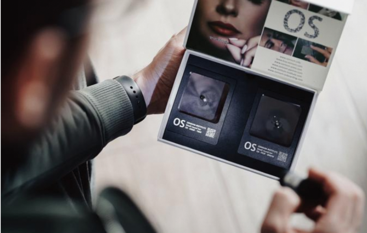
Osmij je glede na vrednost najbolj dragocena plemenita kovina z izjemno čistino in najvišjo obstojnostjo med vsemi plemenitimi kovinami.

Ravno zdaj, v času negotovosti, so naložbe v plemenite kovine izjemnega pomena, kar so prepoznali številni vlagatelji, pandemija covid-19 pa je sprožila pravo mrzlico nakupovanja plemenitih kovin. Prav plemenite kovine so na dolgi rok vedno zagotavljale donose in varovale naša sredstva pred inflacijo. Zlato, platina in srebro so trenutno težje dobavljivi ali pa so na voljo po pretiranih cenah, medtem ko sloves varnega zatočišča v času negotovosti znova potrjuje zadnja izmed osmi plemenitih kovin na svetu - osmij. Osmij trenutno velja za pravi skriti adut med plemenitimi kovinami in edinstveno naložbeno priložnost, ki je ne smete izpustiti iz rok.