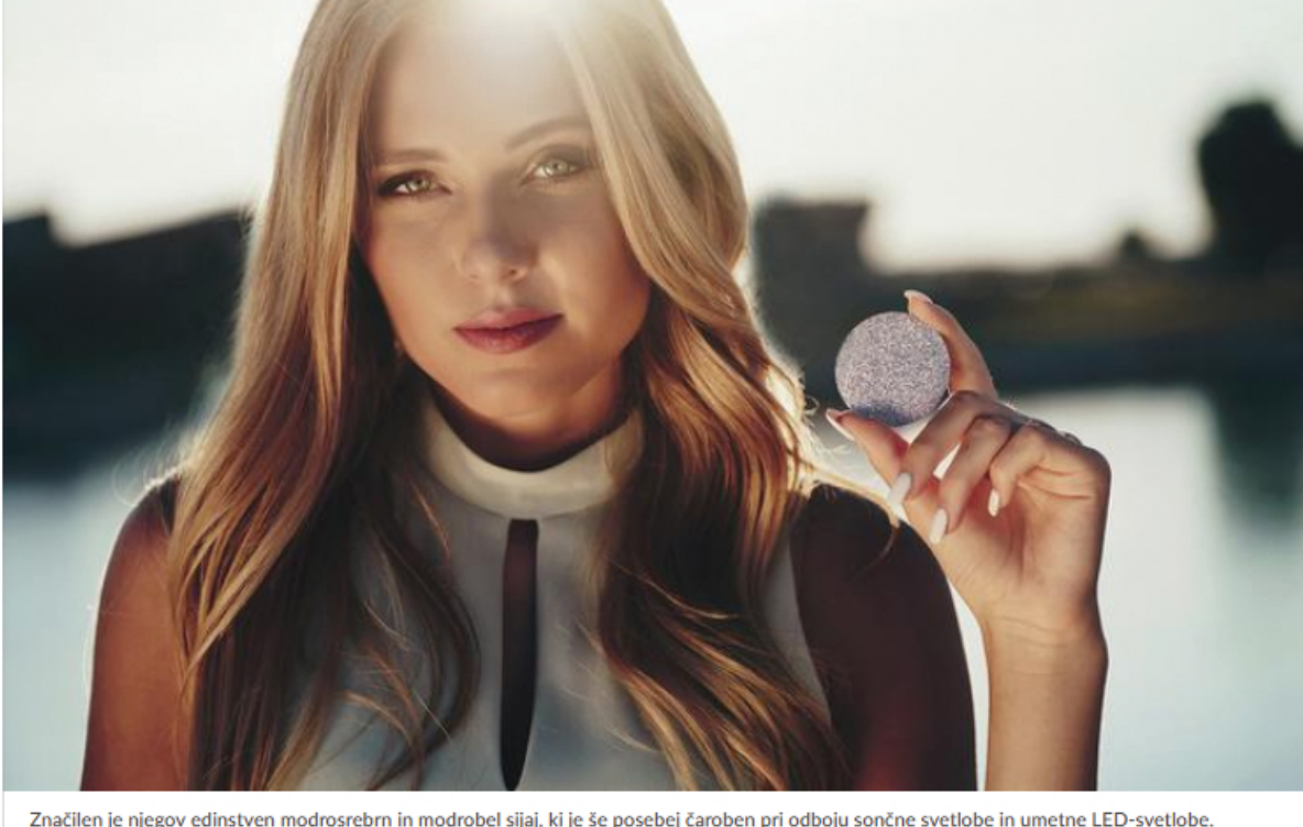
Značilen je njegov edinstven modrosivni in modrobijeli sijaj, ki je še posebej čaroben pri odbiju sončne svetlobe in umetne LED-svetlobe.

Osmija zaradi izjemnih lastnosti (ima največjo gostoto izmed vseh kemijskih elementov in spojin) ni mogoče ponarediti in je izjemno varna plemenita kovina . Hkrati zaradi svoje redkosti dosega najvišjo vrednost izmed plemenitih kovin, s konstantnim donosom pa predstavlja izjemen potencial za prihodnost . Ker je osmij na našem planetu zelo redek in ga je po najnovejših ocenah v zemeljski skorji le okoli 44 ton, je zlahka napovedati trend ponovnega oz. neprestanega povišanja cene.