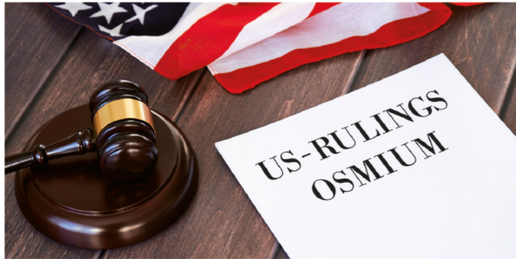
Die US-Rulings und das Zollwarenregister garantieren hohe Sicherheit im Umgang mit kristallinem Osmium. US rulings and the customs goods classification register guarantee a high level of safety when handling crystalline osmium.

Die wichtigsten Grundlagen für den internationalen Handel aber stellen die sogenannten US-Rulings dar. Denn da kristallines Osmium als einziges Edelmetall absolut unfälschbar ist, muss auch erklärt werden, wie der gesamte Welthandel international organisiert ist und wie es erreicht wird, dass Betrug nicht möglich ist.