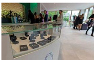
Im Showroom des neuen Osmium-Instituts können Interessierte verschiedene Schmuckstücke ansehen und sich beraten lassen.