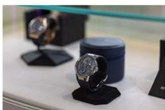
Die Schmuckindustrie hat Osmium inzwischen auch für sich entdeckt, zum Beispiel für hochwertige Armbanduhren.