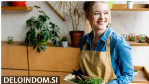
DELOINDOM.SI Ali veste, kaj v resnici manjka vašim sobnim rastlinam?