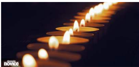
Novice Nenadna smrt: pri 26- letih se je poslovil pevec skupine The Night Cafe