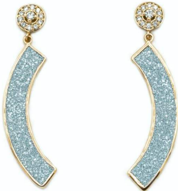
Prestizni nakit s posebnim sijajem.

Zaradi vedno večje uporabe pri izdelavi nakita se ponudba osmija na trgu zmanjšuje. Njegova cena zato nenehno raste.