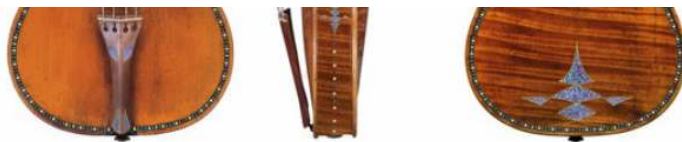
Osmium violina