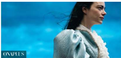
ONAPLUS Najbolj težko pričakovani filmi, ki prihajajo na letošnji Liffe (in so res vredni ogleda)