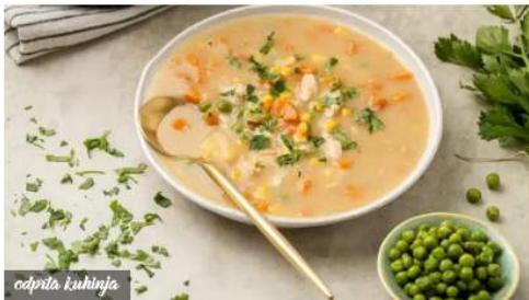
odprta kuhinja Kot bi jo pripravila babica: zelo okusna piščančja juha