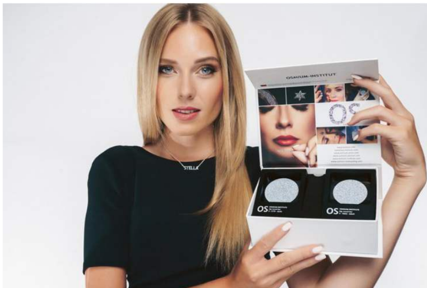
Za naložbo v osmij ne potrebujete velikanskih vsot denarja, saj je na voljo že od približno 150 evrov naprej.