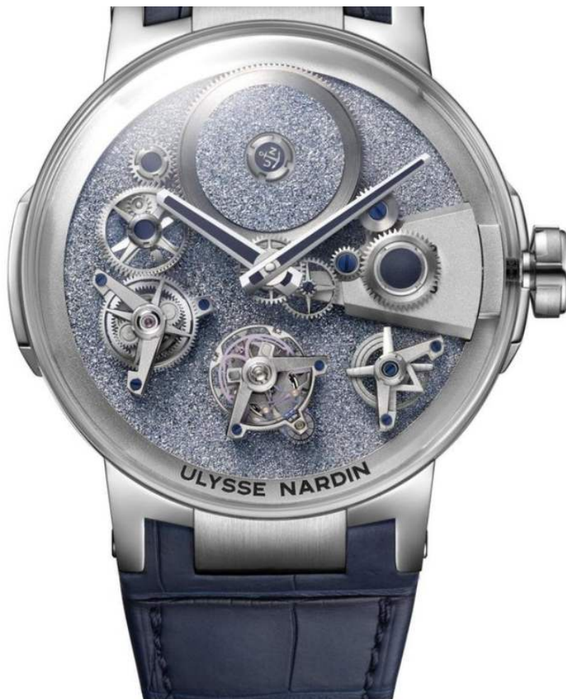
Ura Ulysse Nardin Executive Tourbillon Free Wheel navdušuje s številčnico iz osmija. Ohliske iz belega zlata obkroža kristalno čiste strukture osmija.