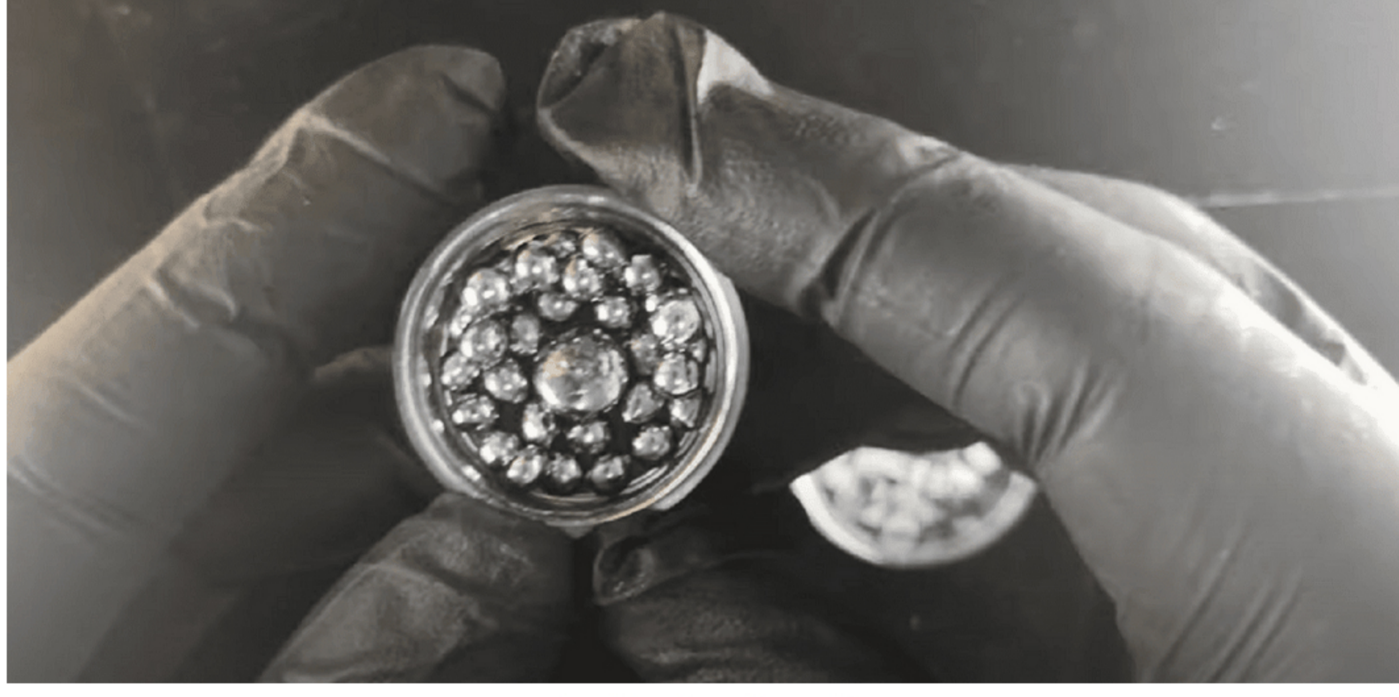
Plemeniti metal

Tetroksid, dobijen iz praškastog ili spužvastog oblika metala, može se koristiti za otkrivanje otisaka prstiju i bojenje masnih tkiva za mikroskopske pločice.