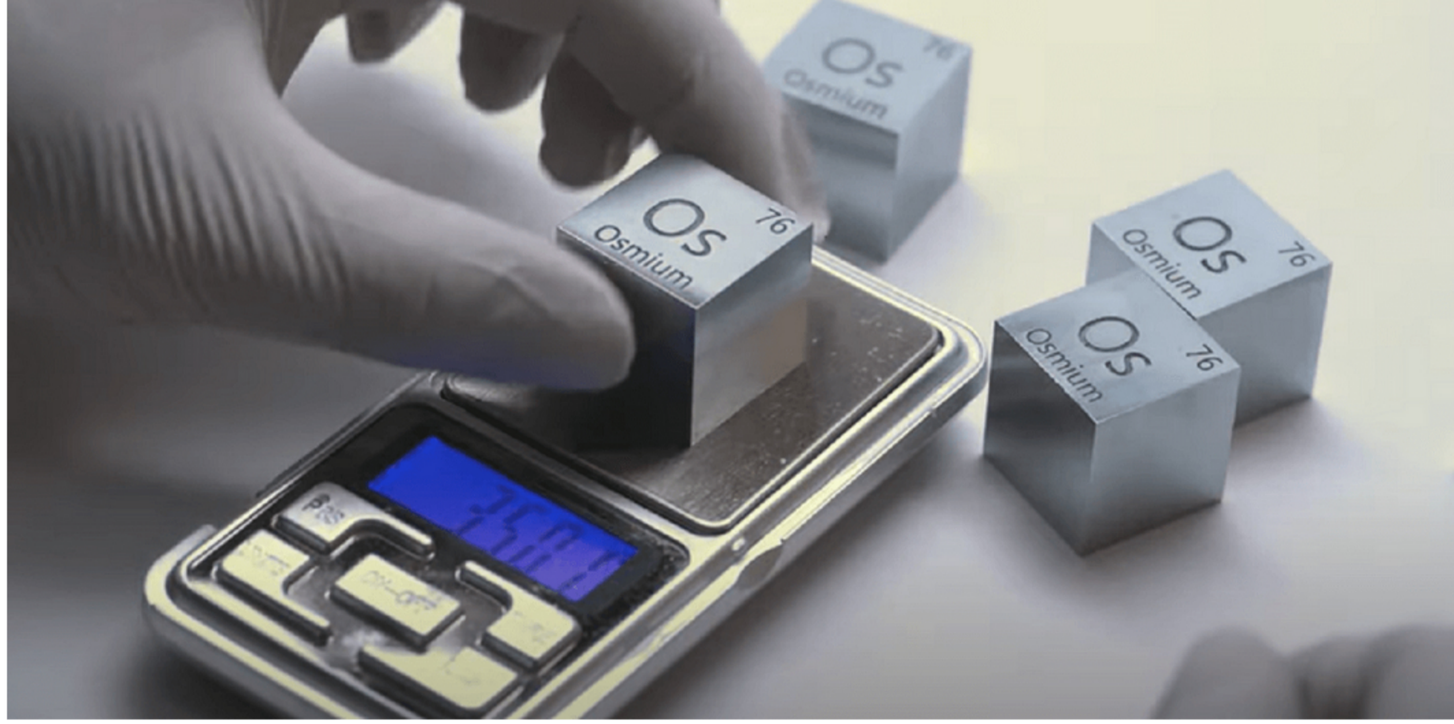
Plemeniti metal

Kada je reč o predelima gde je prisutan, ima ga na Uralu, u Severnoj Americi i u Južnoj Americi.