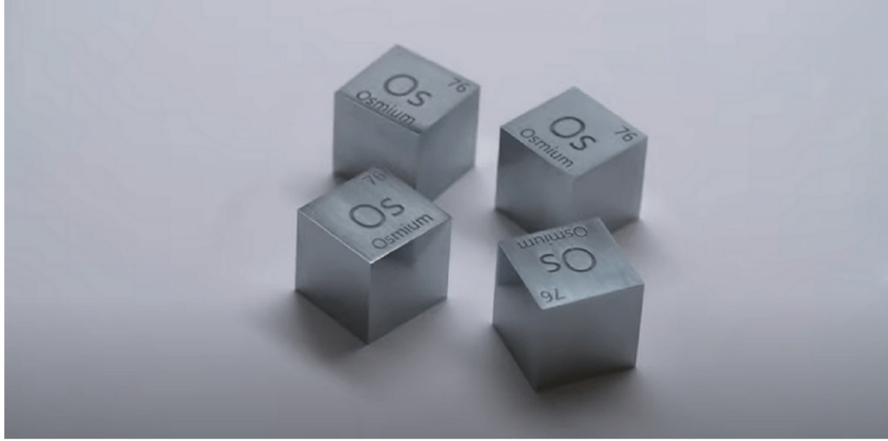
Plemeniti metal

Njegov naziv potiče od grčkog izraza osme, što znači miris. Veoma je toksičan i snažan oksidant sa jakim mirisom, po kom je dobio ime. Jedan je od najgušćih elemenata na svetu. Unutar platinske grupe ima najvišu tačku topljenja i najmanji pritisak pare.